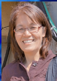
石堂ゆみ師 | Yumi Ishido

エルサレム在住ジャーナリスト石堂ゆみが語る —現代イスラエルを知ってとりなす— イスラエルの今